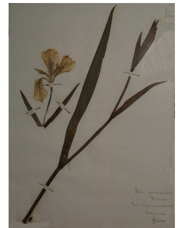
Iridacee. Iris pseudacorus