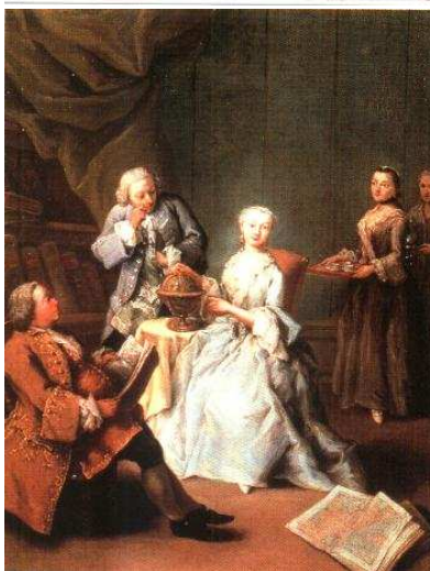
Longhi Pietro, Lezioni di geografia, Venezia