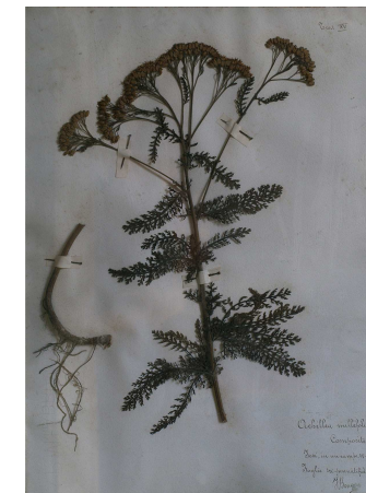
Composite. Achillea millefolium

Ella con la tenacia propria della stirpe di origini a cui